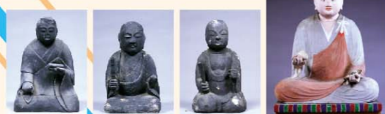
■ 椿神社神像 千僧供町所有(栗東歴史民俗博物館へ寄託)