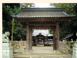
神門(滋賀県指定文化財)

明治以前は十禅師権現と称し、日吉山王の上7社のひとつ樹下神社を勧請した社です。千僧供の地名が示す通り延暦寺の荘園であった時代があり、『源平盛衰記』にある延暦寺に寄進された千僧供養地のひとつと考えられています。