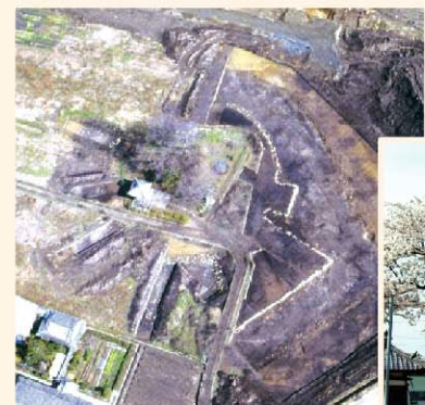
供養塚古墳 (左)発掘当時 (右)現在