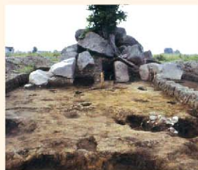
岩塚古墳 発掘当時