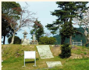
住蓮坊古墳 (左)現在 (上)発掘当時

住蓮坊古墳 は、墳丘径が約53m、堀を含めるとその径が約93mにも及ぶ県下でも屈指の大形円墳です。葺石、埴輪は確認されていません。堀から出土した遺物から、5世紀中頃の築造と考えられます。 供養塚古墳 は、もとは円墳と考えられていましたが、昭和57年度に実施した発掘調査の結果、後円部径約37m、前方部幅約22m、堀を含めると全長が約70mの帆立貝式の古墳であることがわかりました。葺石があり、多くの形象埴輪が出土しており、この年代から5世紀の終わり頃に築造されたと考えられます。また、江戸時代と昭和9年に鏡や武器武具類が出土したことが知られています。 岩塚古墳 は、径が27.5mの円墳で、幅2m、長さ11mの横穴式石室が露出しています。6世紀末頃の築造と考えられます。 トギス塚古墳 は、主体部のほとんどが消失していますが、直径が14m程度の円墳で、幅1.5m、長さ5mの横穴式石室を主体部とします。出土した土器から7世紀初頭の築造と考えられます。