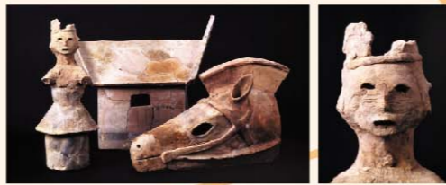
■ 供養塚古墳出土埴輪

千僧供町豆知識 1 古墳時代中期(5世紀後半頃)の古墳。これまで幾度の探掘により古鏡、水晶、刀剣、短甲などが出土した。昭和57年の発掘調査で軌立貝式古墳であることや、後円部には幅約4メートル、長さ8メートルの「造り出し」を設ける稀な古墳です。さらに周家内から、家・衣蓋・鞆・人物・馬などの形象埴輪が多量に出土した。